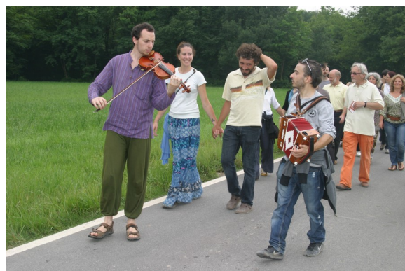
un momento della MAZURKA KAMPESTRE

L'idea base è quella di un pubblico itinerante durante il pomeriggio, che possa passeggiare lungo le aree del parco del Curone, e itinerari individuati all'interno dei paesi, a suo piacimento possa soffermarsi per godere, di un paesaggio, di un piccolo concerto o una danza. Mentre per la sera si cercherà di far convergere gli spettatori all' Azienda Agricola Bagaggera, o in altre piazze capienti, per i concerti conclusivi della giornata di festa.