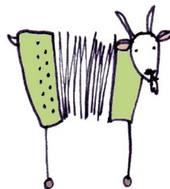
Logo creato da Alessia Bervini

Nella prima e seconda edizione ci siamo avvalsi del prezioso lavoro della pittrice Svizzera, Alessia Bervini ( www.alessiabervini.ch ). E' piaciuta talmente tanto questa capretta a fisarmonica da farla poi diventare il logo della nostra manifestazione.