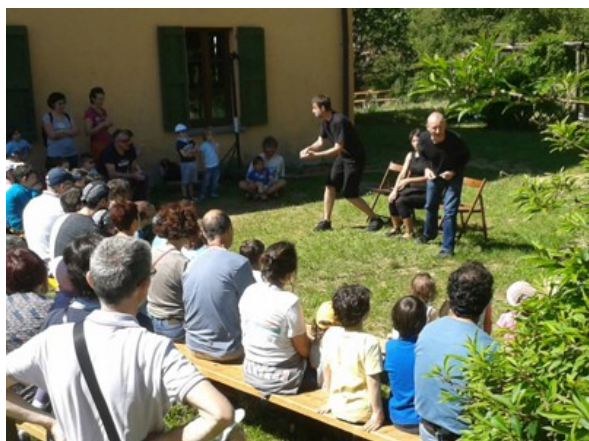
racconti in compagnia dei CONFABULA

Fin dalla prima edizione, è stata nostra premura riservare una parte della programmazione del festival al pubblico di bambini e bambine. Solitamente nella mattinata di domenica, i bimbi possono assistere a uno spettacolo pensato per loro; in questi anni è stato chiamato diversi artisti/e che con spettacoli di improvvisazione teatrale, clownerie, giocoleria, spettacoli appositi sono stati in grado di incantare e far divertire grandi e piccoli.