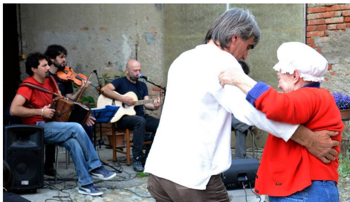
concerto con la BANDAFFARI alla cascina Fornace Superiore