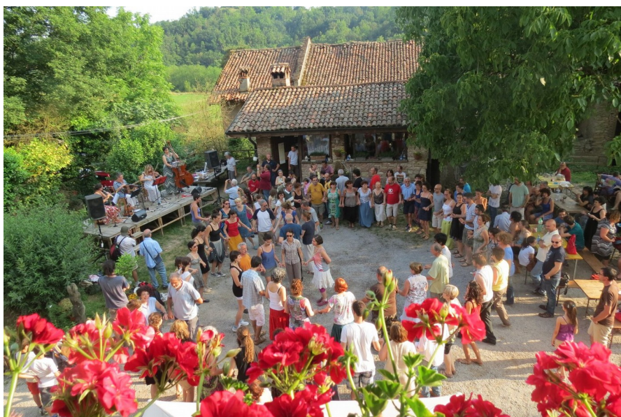
FemmeFolk in concerto

Per affrontare gli inevitabili risvolti economici del festival (noleggi attrezzature, stampa manifesti e materiale informativo, cachet gruppi musicali, rimborso viaggi, luce, acqua...), riteniamo indispensabile che ad alcuni eventi della giornata sia possibile accedere dietro pagamento di un biglietto di ingresso che cercheremo di tenere il